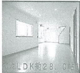
南側にテラスあり日当たり良好