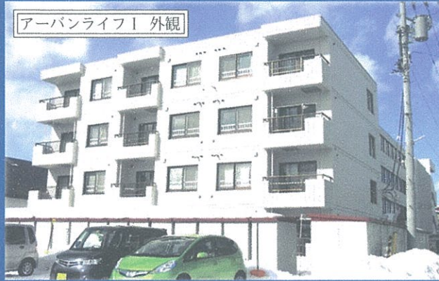
アーバンライフⅠ 外観