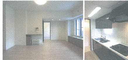
■LD・キッチン(平成28年1月撮影)