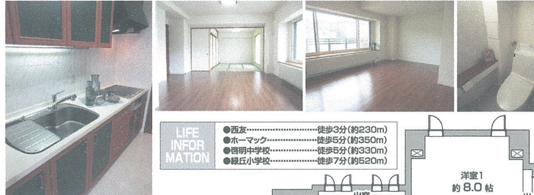
●キッチン、LD、トイレ(平成27年7月撮影)