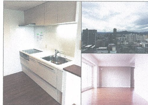
■キッチン・眺望・リビングダイニング (平成27年9月撮影)