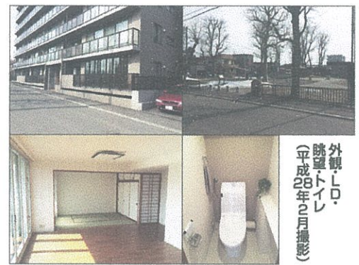
外観・眺望・トイレ (平成28年2月撮影)