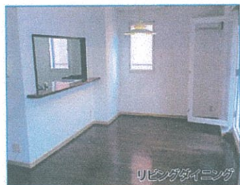
リビングダイニング