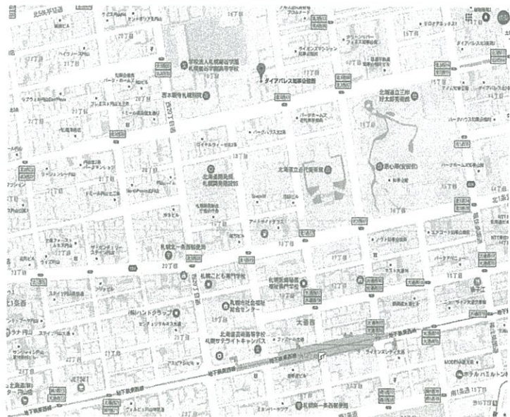
*このハウジングマップは概要紹介図です。図面と現況が異なる場合は現況優先となります。