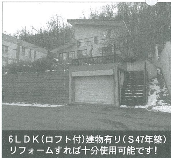
6LDK(ロフト付)建物有り(S47年築) リフォームすれば十分使用可能です!