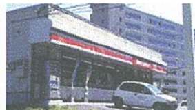
セイコーマート…徒歩6分