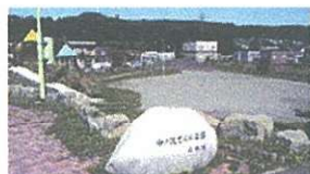
さくら公園…徒歩2分