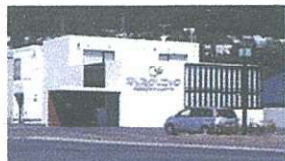
なりたクリニック…徒歩10分