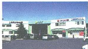
ショッピングセンターREX…徒歩5分