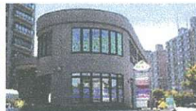
メディカルビルREX…徒歩5分