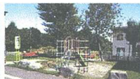
ボブラ公園…徒歩2分